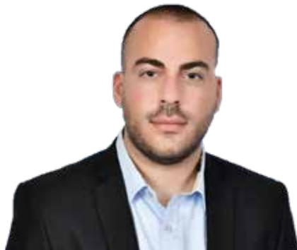
Σωτήρης Ιωάννου Βουλευτής Λάρνακας - ΕΛΑΜ

Παράλληλα θα εργαστώ για να βελτιώσουμε τις υποδομές υγείας. Πετύχαμε την λειτουργία ογκολογικών υπηρεσιών στην Λάρνακα θα εργαστούμε και για υποδομές που θα αφορούν και άλλους χρόνιους ασθενείς.