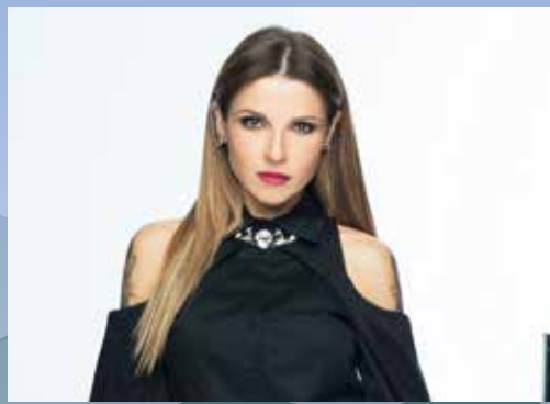
ΕΥΡΥΔΙΚΗ ΣΑΒΒΑΤΟ 30 ΜΑΪΟΥ | 21:50