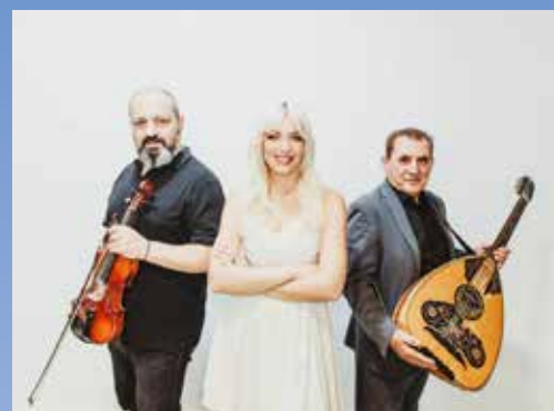
ΜΟΥΣΙΚΟ ΣΧΗΜΑ ΜΙΧΑΛΗ ΧΑΤΖΗΜΙΧΑΗΛ ΠΑΡΑΣΚΕΥΗ 29 ΜΑΪΟΥ | 20:45

Από τη μεγάλη γιορτή του Κατακλυσμού δεν θα μπορούσαν να απουσιάζουν αγαπημένοι καλλιτέχνες από την Κύπρο και την Ελλάδα, οι οποίοι θα ανεβούν στη σκηνή τόσο της Πλατείας Ευρώπης όσο και της Κεντρικής Εξέδρας και θα χαρίσουν μοναδικές μουσικές βραδιές στο κοινό.