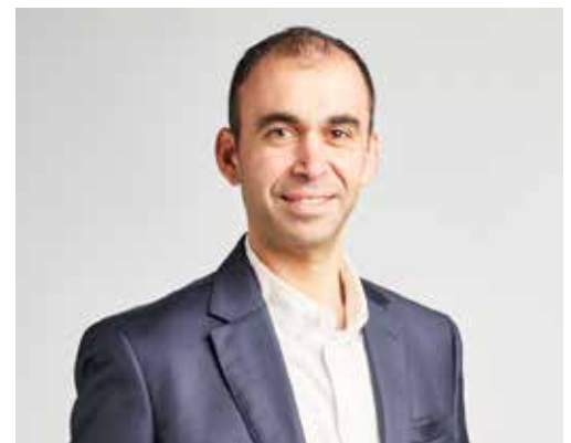
Ανδρέας Πασιουρτίδης Βουλευτής Λάρνακας - ΑΚΕΛ Αριστερά Κοινωνική Συμμαχία

Ο στόχος ζωής, είναι η στήριξη των συνανθρώπων μας που έχουν ανάγκη την αρωγή και στήριξη της πολιτείας για ζωή με αξιοπρέπεια, όπως τα άτομα με αναπηρίες - ΑμέΑ και άλλα άτομα που βρίσκονται για διάφορους λόγους στο κοινωνικό περιθώριο και άλλα.