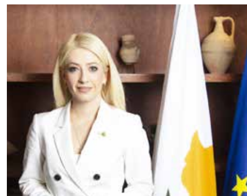
Αννίτα Δημητρίου Πρόεδρος ΔΗΣΥ Βουλευτής Λάρνακας

Οι βουλευτές καλούνται να διαχειριστούν ζητήματα που αφορούν την πρόοδο της πόλης, αλλά και την ευημερία του τόπου μας γενικότερα, με κοινό στόχο ένα καλύτερο αύριο.