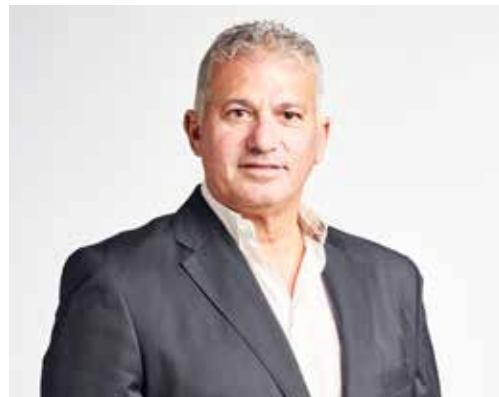
Πανίκος Ξιούρουπας Βουλευτής Λάρνακας - ΑΚΕΛ Αριστερά Κοινωνική Συμμαχία

Το όραμα μου σε αυτή τη νέα κοινοβουλευτική περίοδο είναι να συνεχίσουμε το έργο που ξεκινήσαμε από το 2021. Ευχαριστώ όσους με τίμησαν με την εμπιστοσύνη τους και μου έδωσαν την ευκαιρία να τους εκπροσωπήσω ξανά. Συνεχίζουμε με τον καλύτερο δυνατό τρόπο με προτεραιότητα τον Κύπριο πολίτη, τη Λάρνακα, τον τόπο μας.