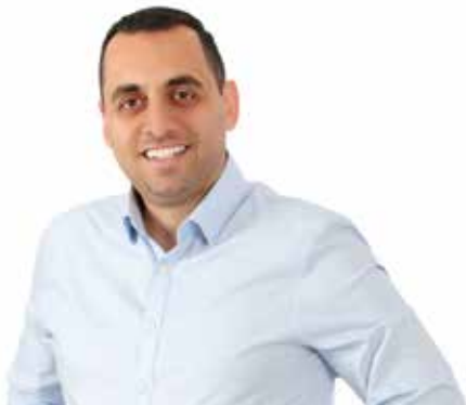
Ανδρέας Αποστόλου Βουλευτής Λάρνακας - ΔΗΚΟ

Μια Λάρνακα σύγχρονη, εξωστρεφής και ανταγωνιστική. Μια πόλη που να προσελκύει νέες επιχειρήσεις, τεχνολογία, πανεπιστήμια, καινοτομία και ευκαιρίες για τη νέα γενιά.