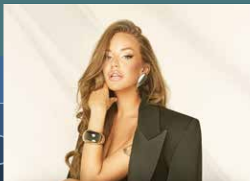
ΑΝΔΡΟΜΑΧΗ ΤΡΙΤΗ 2 ΙΟΥΝΙΟΥ | 22:15