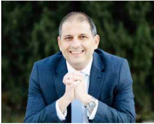
Πρόδρομος Αλαμπρίτης Βουλευτής Λάρνακας - ΔΗΣΥ

Η επόμενη πενταετία πρέπει να είναι πενταετία μεγάλων αλλαγών για τη Λάρνακα. Πενταετία ανάπτυξης, εξωστρέφειας και νέων διεκδικήσεων.