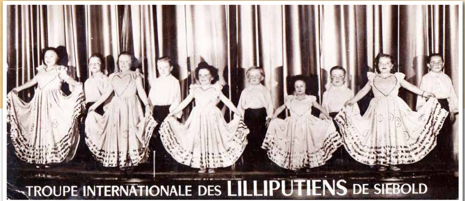
Ευχαριστώ για τις φωτογραφίες και τις πληροφορίες τον Κίκη Κύπαρη και την Βιόλα Ποταμίτου-Τουμαζή